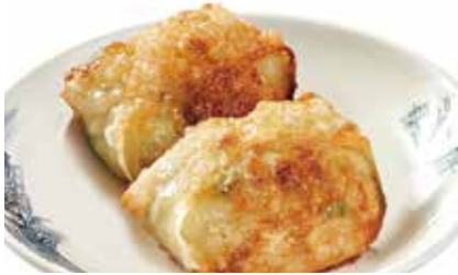
몽콕식 튀김만두 (2pcs) ₩7,000 Pan-Fried Pork Dumpling 韭菜猪肉锅贴