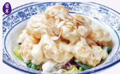
아몬드 레몬 크림 새우 ₩34,000 Deep-Fried Prawn with Mayonnaise Sauce & Almond 杏仁沙律虾球