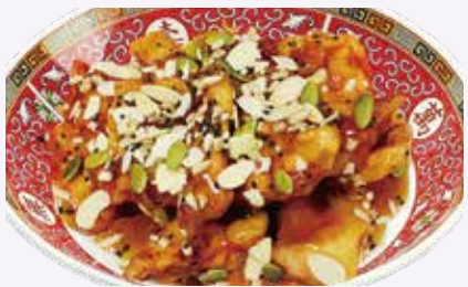
오곡 등심 탕수육 ₩32,000 Sweet and Sour Pork with Mixed Nuts 坚果猪外脊糖醋肉