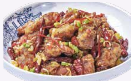
통마늘 간풍기 ₩32,000 Deep-Fried Chicken with Garlic & Red Peppers 干烹鸡球