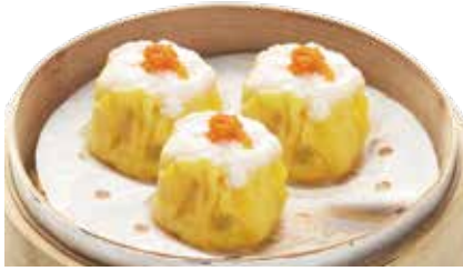
쇼마이 (3pcs) ₩7,500 Steamed Pork & Shrimp Dumpling with Fish Roe 鱼籽烧卖